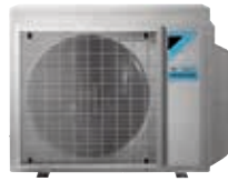
5MXM 5 Innengeräte